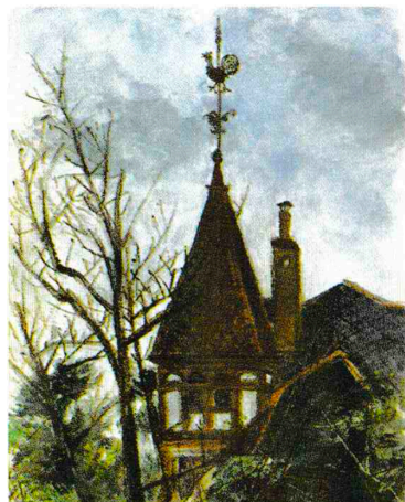
風見鶏 西村 功